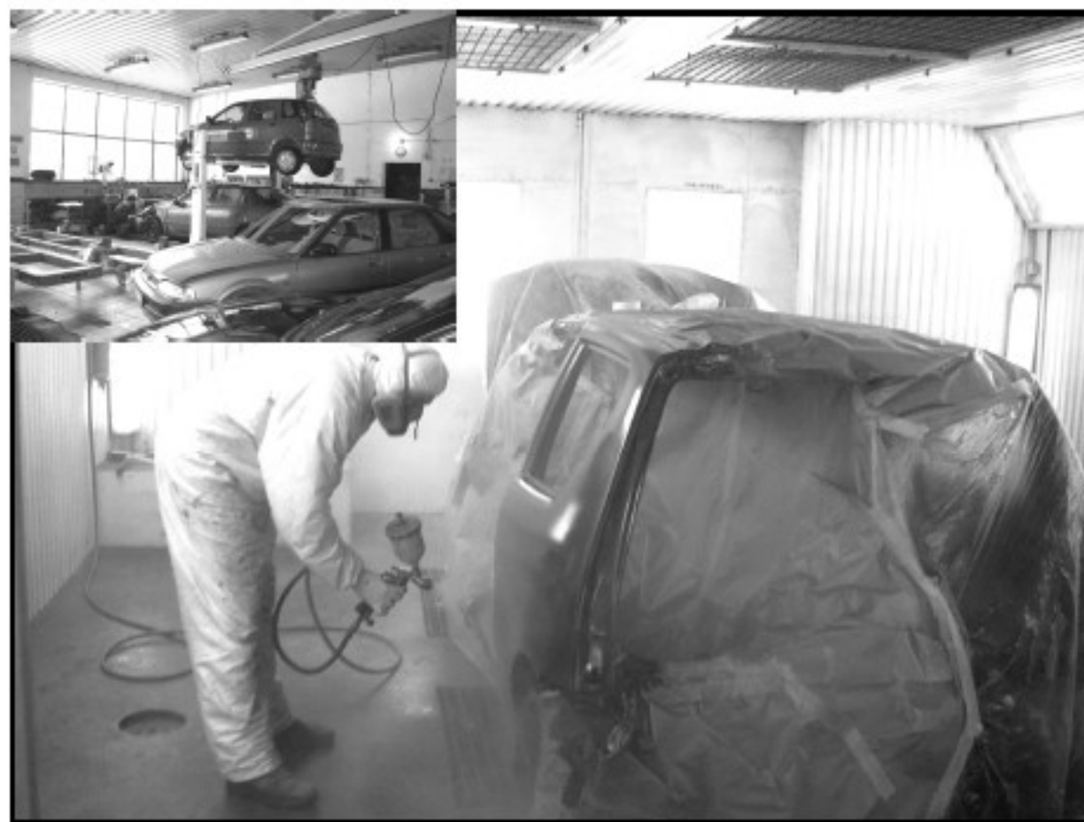
Podczas pracy w kabine lakierniczej stosuje się tylko i wyłącznie lakiery renomowanej firmy Du- Pont.

Ich zakład świadczy kompleksowe usługi: blacharskie, lakiernicze, mecha-