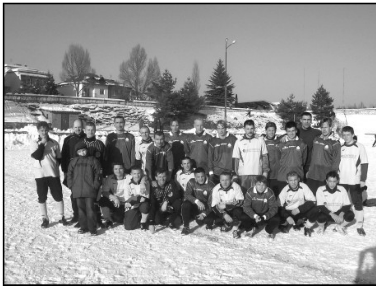
Minimalna porażka 0:1 z Ruchem Chorzów nastroja optymistycznie przed rundą rewanżową