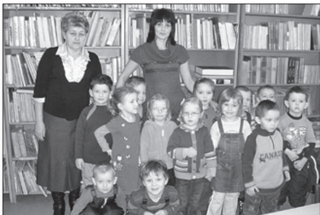
Zespół Szkół Nr 2