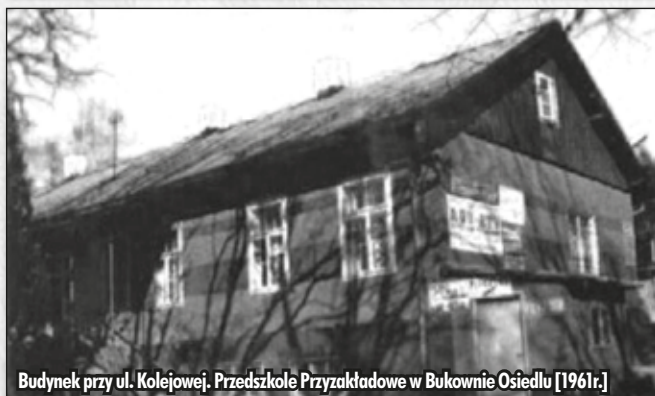
Budynek przy ul. Kolejowej. Przedszkole Przyzakładowe w Bukownie Osiedlu [1961r.]