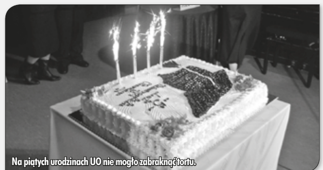
Na piątých urodzinach UO nie mogło zabraknąć tortu.