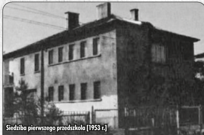
Siedziba pierwszego przedszkola [1953 r.]