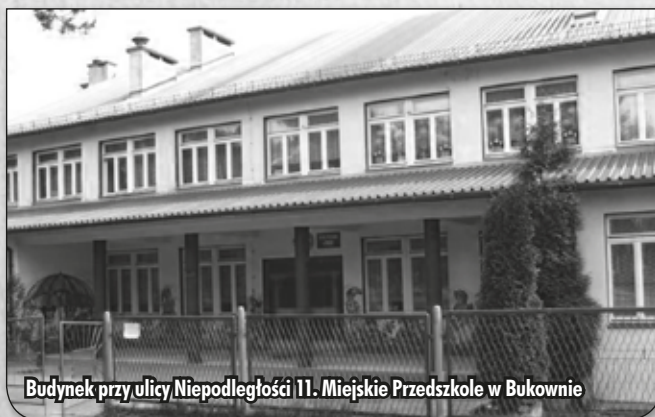
Budynek przy ulicy Niepodległości 11. Miejskie Przedszkole w Bukownie