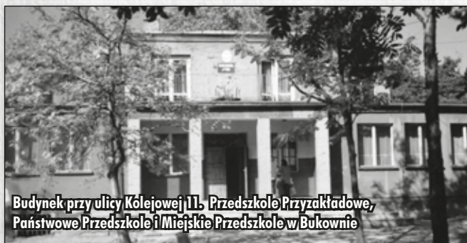
Budynek przy ulicy Kolejowej 11. Przedszkole Przyzakładowe, Państwowe Przedszkole i Miejskie Przedszkole w Bukownie