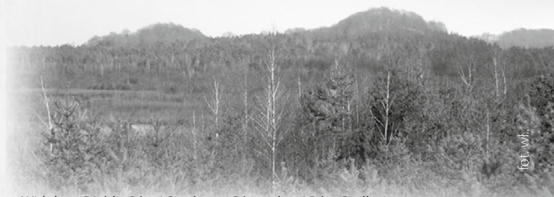
Widok na Diabłą Górę i Stoskową Górę z drogi Bór - Podlesie.

Kto nie zna historii swego kraju, swego miasta i wioski to jakby swego ojca i matki nie znał ks. Piotr Skarga