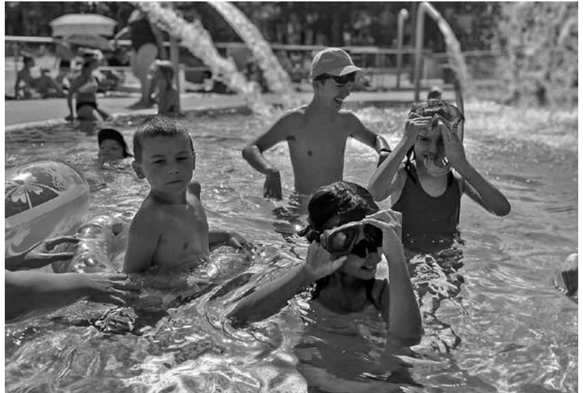
Program OPIEKA WYTCNIENIOWA dla opiekunów osób niepełnosprawnych

W okresie wakacyjnym na świetlicy atrakcji nie brakuje. Zabawa na świeżym powietrzu, konkursy, spacer, wyjscia na basen - to nasze codzienne zajęcia. Niedawno odbył się u nas konkurs plastyczny pod tytułem „Na morza dnie”, podczas którego dzieci za pomocą wybranej przez siebie techniki wykonywały prace przedstawiające różne morskie zwierzęta i rośliny. Prace były przepiękne, każdy z wychowanków wykazał się pomysłowością oraz talentem. W ciepłe dni dla ochłody chodzimy na basen; tam uczymy się pływać, gramy w siatkę i wymyślamy różne zabawy. Niedługo nadejdzie rok szkolny i wrócimy do nauki i odrabiania lekcji, jednak na razie korzystamy ze wszystkiego, co oferuje nam lato. ■