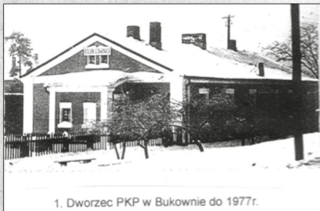
1. Dworzec PKP w Bukownie do 1977r.

Miasto Bukowno liczące w dniu 31 grudnia 1966 roku ponad 6-tysięcy mieszkańców do chwili wyzwolenia spod okupacji niemieckiej nie istniało. Była tylko stacja kolejowa, a raczej przystanek kolejowy z jedynym budynkiem stacyjnym pod nazwą BUKOWNO" - to pierwsze słowa zapisane w jedynej kronice miejskiej.