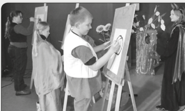
KONKURS PLASTYCZNY Z DIABEŁKIEM W TLE