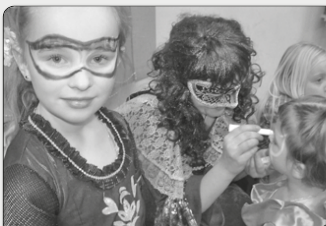
MASKA NA CIELE NA PEWNO NIE ZGINIE