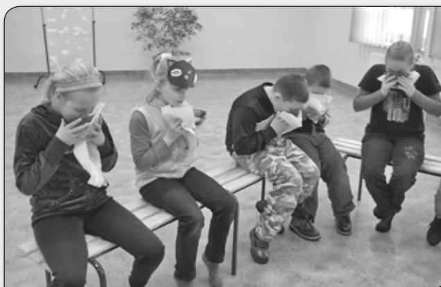
JAK KOTEK Z MISECZKI