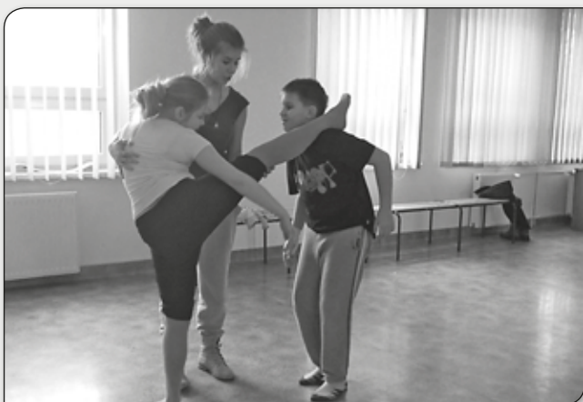
WYGINAM ŚMIAŁO CIAŁO