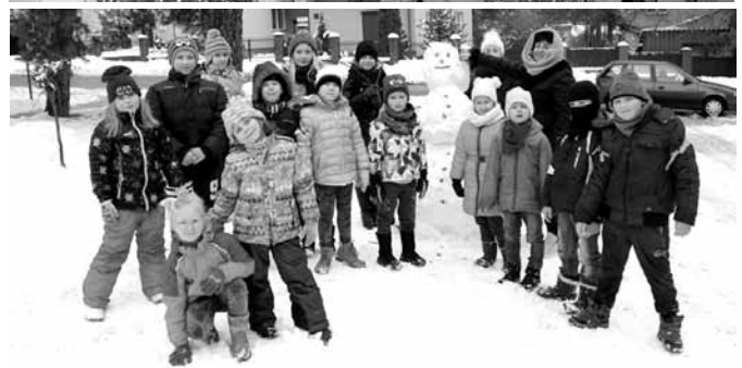
Udało się tej zimy wspólnie ulepić bałwana, a nawet zrobić go ze skarpetki :-)