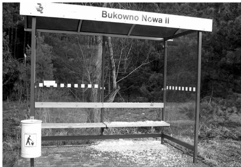
Tylko od początku 2017 roku zdewastowane zostały wiaty przystankowe zlokalizowane przy ulicach Wodącej, Nowej, Starczynowskiej i Ogrodowej.

Myślę, że kiedyś się doczekam i zamieszczając taką informację w Głosie Bukowna i na stronie internetowej Urzędu Miejskiego będę mógł jednocześnie podziękować Mieszkańcom i Policji za prawdziwie obywatelską postawę i skuteczne działanie.