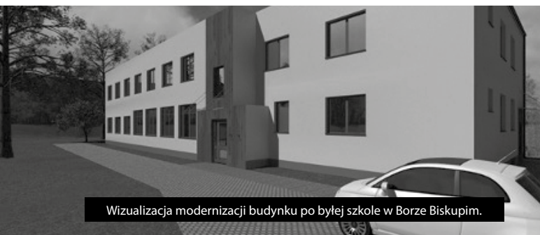
Wizualizacja modernizacji budynku po byłej szkole w Borze Biskupim.

P onad 4 mln zł z budżetu państwa trafiło ostatnio do Bukowna. To efekt najnowszych rozstrzygnięć naborów w dwóch rządowych programach celowych - Rządowym Funduszu Inicjatyw Lokalnych oraz Rządowym Funduszu Rozwoju Dróg. Środki te trafią na inwestycje realizowane obecnie lub w najbliższej przyszłości.