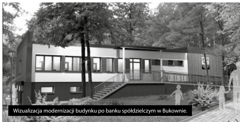
Wizualizacja modernizacji budynku po banku spółdzielczym w Bukownie.

System CEEB przeznaczony jest do realizacji ustawowych zadań związanych z ochroną środowiska, termomodernizacją i walką z ubóstwem energetycznym. Za powstanie systemu odpowiada Główny Urząd Nadzoru Budowlanego. Celem zbierania informacji o budynkach jest stworzenie kompletnej bazy danych, na podstawie której każda gmina w Polsce będzie mogła podejmować odpowiednie działania na rzecz poprawy jakości powietrza.