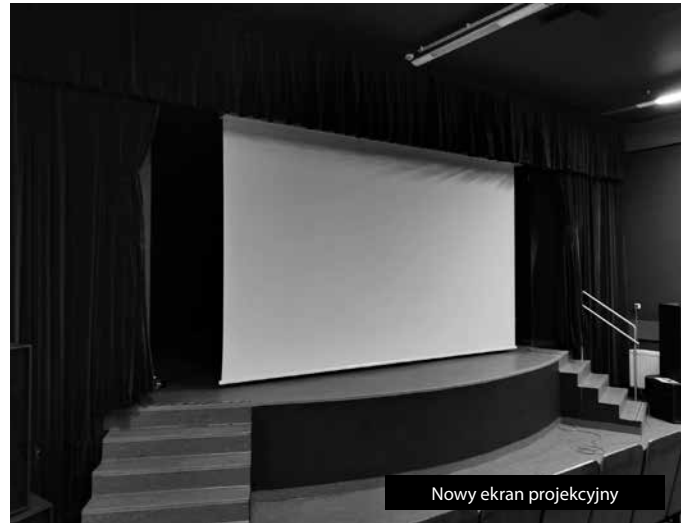
Nowy ekran projekcyjny

Obecnie trwają przygotowania do projektu „Bukowno lokalnie i kulturalnie”. W ramach akcji zostanie zorganizowanych 6 imprez, wśród których znajdują się: koncert „Bukowno dla kobiet”, Bukowieńska Noc Teatru, spotkanie promujące wydanie antologii wierszy bukowieńskich poetów, przegląd zespołów ludowych, konkurs plastyczny „Bukowno dla papieża” oraz konkurs kulinarny pn. „Bukowieńskie smaki”. Dzięki udziałowi w projekcie na sali widowiskowej MOK zamontowany został nowy ekran projekcyjny, który zapewni większy komfort podczas organizowanych seansów filmowych.