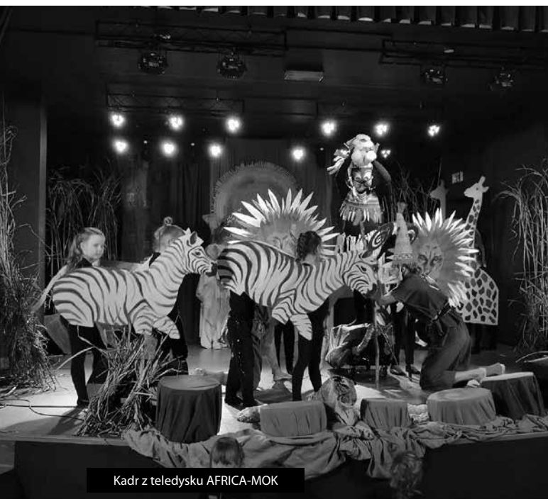
Kadr z teledysku AFRICA-MOK

Pokłosiem konkursu jest tom wierszy z utworami wszystkich biorących udział w konkursie poetów.