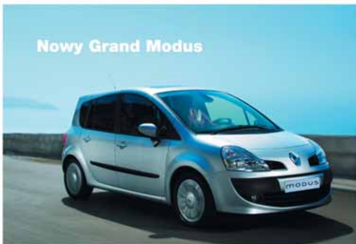
Nowy Grand Modus