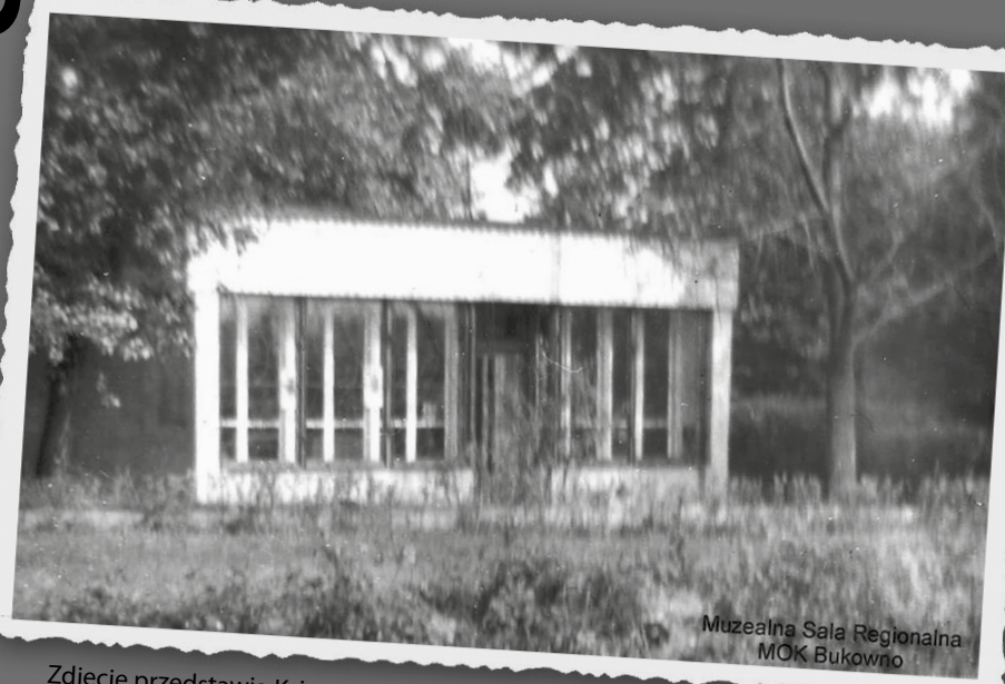
Zdjęcie przedstawia Księgarnię „Domu Książki”, na przełomie 1989/1990 r., Bukowno.