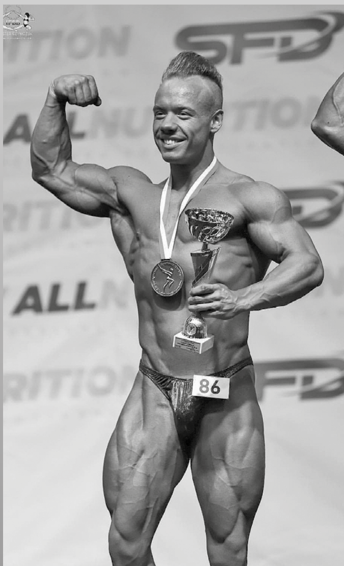
Fot. FB Bartek Chojowski - Trener Personalny

A.Z.: Dziękuję za rozmowę i życzę kolejnych sukcesów! ■