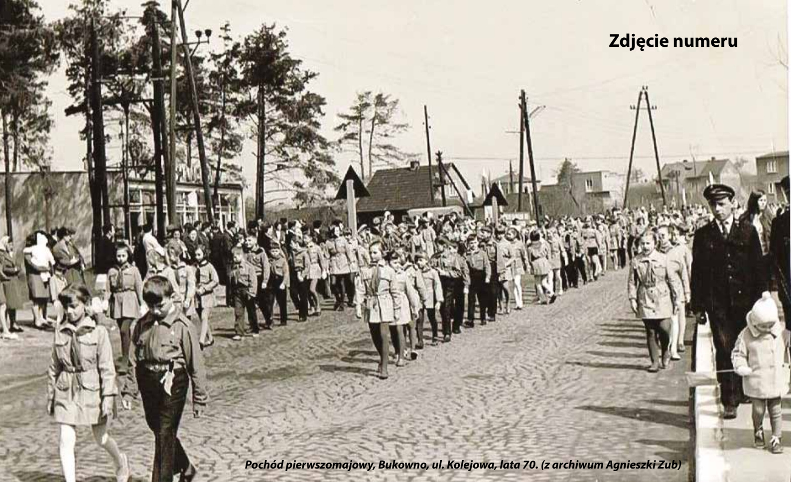
Pochód pierwszomajowy, Bukowno, ul. Kolejowa, lata 70.