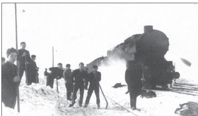
Uczniowie szkoły górniczej odsnieżają tory kolejowe w Bukownie, za co szkoła otrzymała z DOKP w Lublinie dyplom i radio marki "Romans".