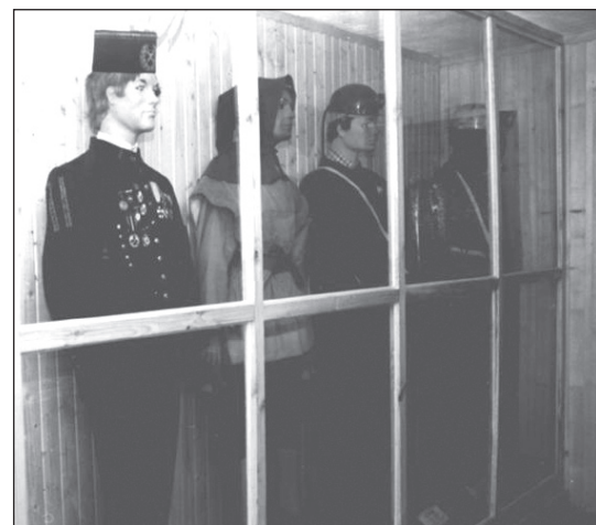
Stroje górnicze w muzeum