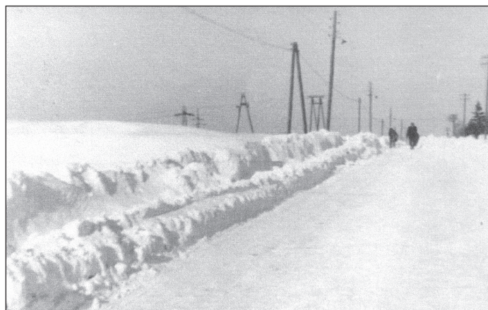
Zaspy śnieżne na ulicy Kolejowej.