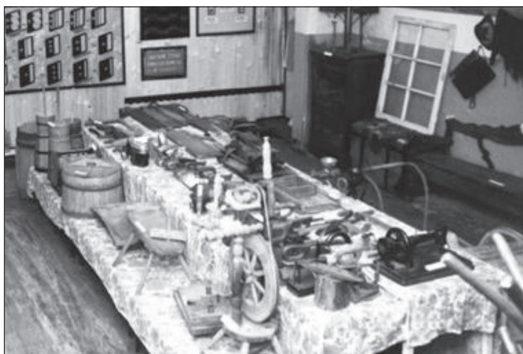
Sala regionalna w Muzeum Górnicztwa Rud