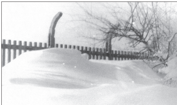
Zasypane dojście do szkoły górniczej w Skalce.