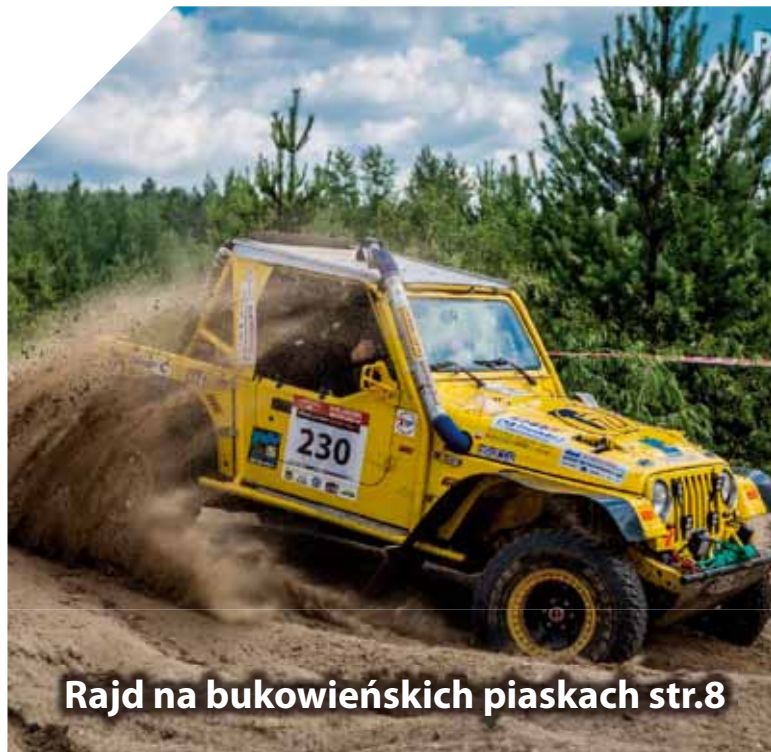
Rajd na bukowieńskich piaskach str.8

■ Lipiec/Sierpień ■ Nr 04/14 ■ GAZETA BEZPŁATNA