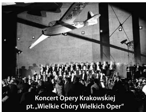
Koncert Opery Krakowskiej pt. „Wielkie Chóry Wielkich Oper“