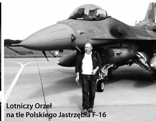
Lotniczy Orzeł na tle Polskiego Jastrzębia F-16

BURMISTRZ MIASTA BUKOWNO MOSiR W BUKOWNIE oraz UKS KUSY zapraszają na