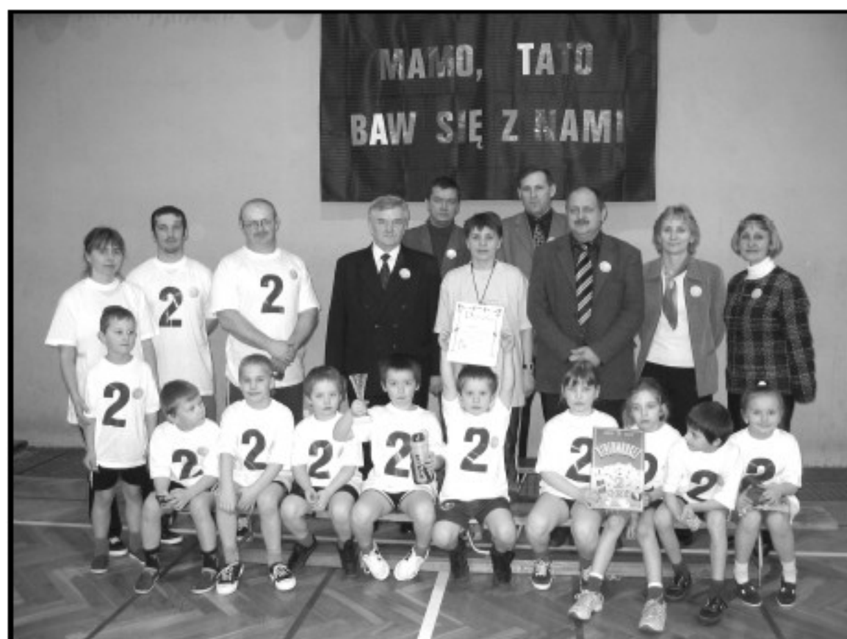
Zwycięska drużyna ze Szkoły Podstawowej nr 2 w Bukownie

Atrakcją dla dzieci był PINGWIN, który miał dla dzieci słodką niespodziankę.