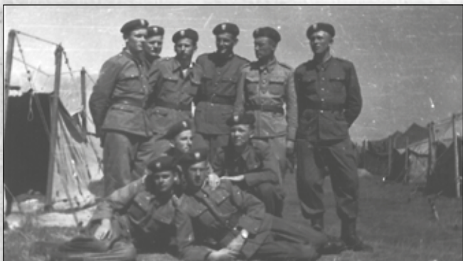
Pamiątka z wojska, przygotowanie do defilady, Łódź 1957 r. (pierwszy od lewej) - ze zbiorów prywatnych