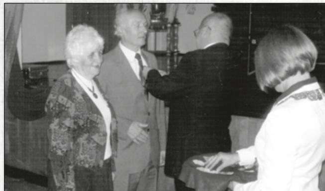
Jubileusz 50-lecia Pożycia Matżeńskiego

otworzył się spadochron, zginął na miejscu. W lutym, przy temperaturze 20 stopni mrozu, w Kasince mieszkaliśmy w namiotach. Po służbie wojskowej w 1959 roku wróciłem do pracy w Elektrolizie Cynku.