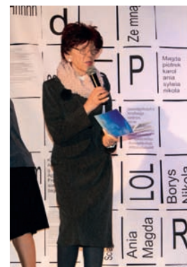
Wyróżnienie w kat. poetyckiego sms-u