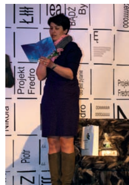
Złote Diabelskie Pióro, wyróżnienie w kategorii ogólnej