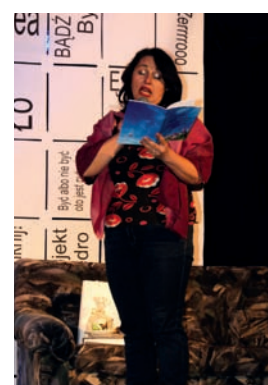
Braźowe Diabelskie Pióro