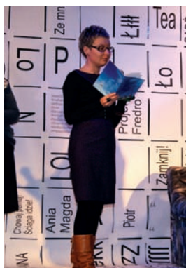
Mistrz Krótkiego Przekazu