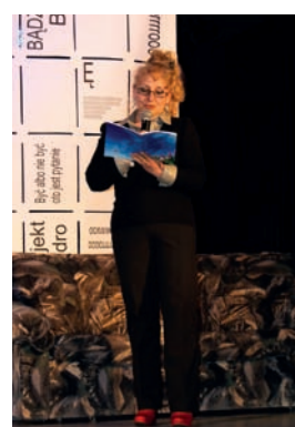
Srebrny Liść Bukowy, Srebrne Diabelskie Pióro, Mistrz Krótkiego Przekazu