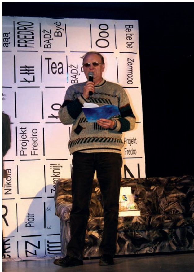
Złoty Liść Bukowy, dwa wyróżnienia w kat.: regionalnej oraz poetyckiego sms-u