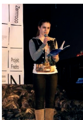
Wyróżnienie w kat. poetyckiego sms-u