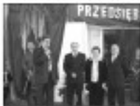
W tym roku w dniach 12-14 października w Bukowie odbyły się Dni Bukowna 2004. W tym czasie w naszym mieście odbyły się liczne imprezy kulturalne i sportowe.

W tym roku w dniach 12-14 października w Bukowie odbyły się Dni Bukowna 2004. W tym czasie w naszym mieście odbyły się liczne imprezy kulturalne i sportowe. W dniach 12-14 października w Bukowie odbyły się Dni Bukowna 2004. W tym czasie w naszym mieście odbyły się liczne imprezy kulturalne i sportowe.