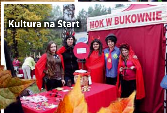
Kultura na Start