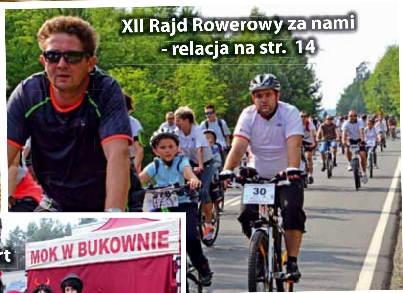
XII Rajd Rowerowy za nami - relacja na str. 14