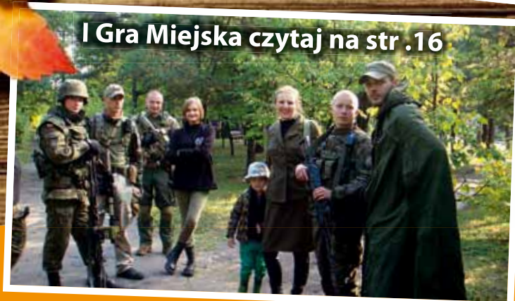
I Gra Miejska czytaj na str. 16