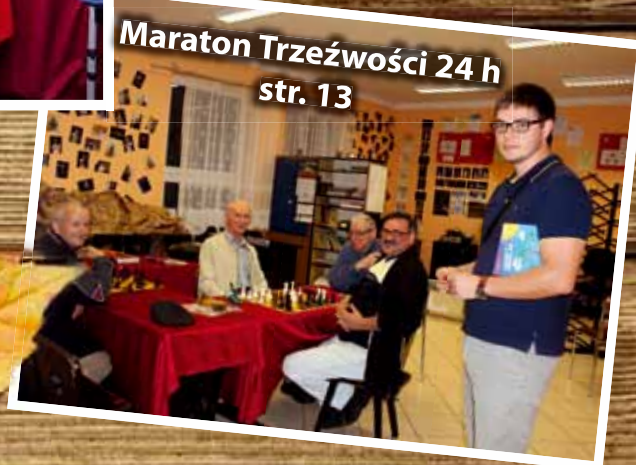
Maraton Trzeźwości 24 h str. 13