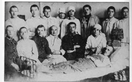
Na Skałce w kilku salach był szpital wojskowy. 1920 r.